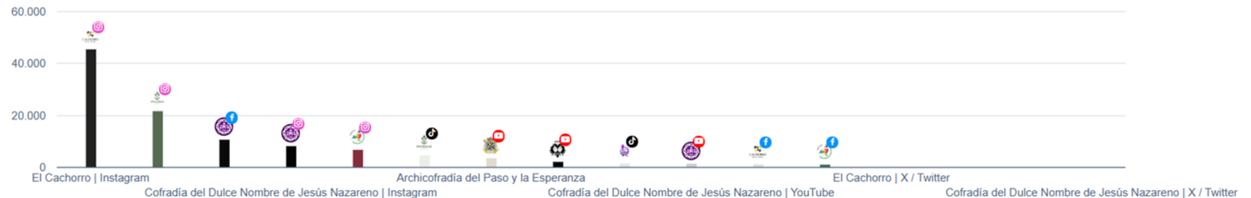
Perfiles con más seguidores