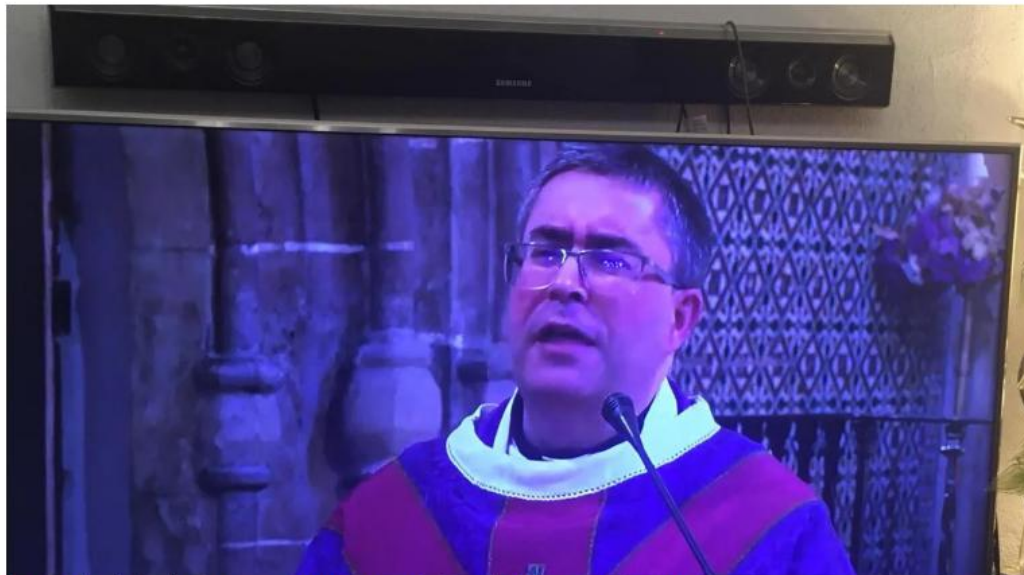
El Consejo de Cofradías ofrece la misa en streaming el domingo desde la capilla de Santa María de Jesús ABC

Iglesias y templos de Sevilla y provincia ofrecerán la Eucaristía a través de sus redes sociales